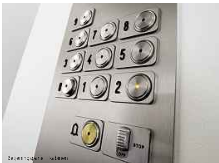
Betjeningspanel i kabinen

FL MXV tilbyder passageren logiske funktioner og er nem at betjene. Det opfylder alle sikkerhedsbestemmelser for eksisterende elevatorer. Det er naturligvis velegnet til handicappede mennesker og kan ligeledes udstyres med blindeskrift. Systemet understøtter indbygning af en 2-vejs kommunikationslinje til 24-timers bemandet vagtcentral.