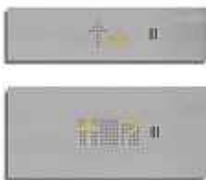
Betjeningspanel i kabinen ►►