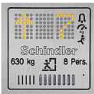
Digital indikatorpanel i kabinen