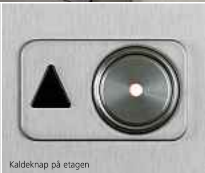
Kaldeknop på etagen