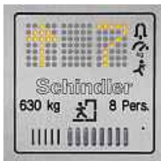
Digital indikatorpanel i kabinen